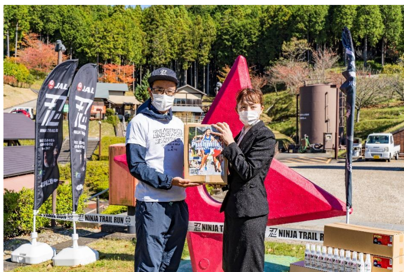
【左：実行委員長 恵川様 右：当社 スポーツ支援担当（三重とこわか国体 女子ホッケー代表）】